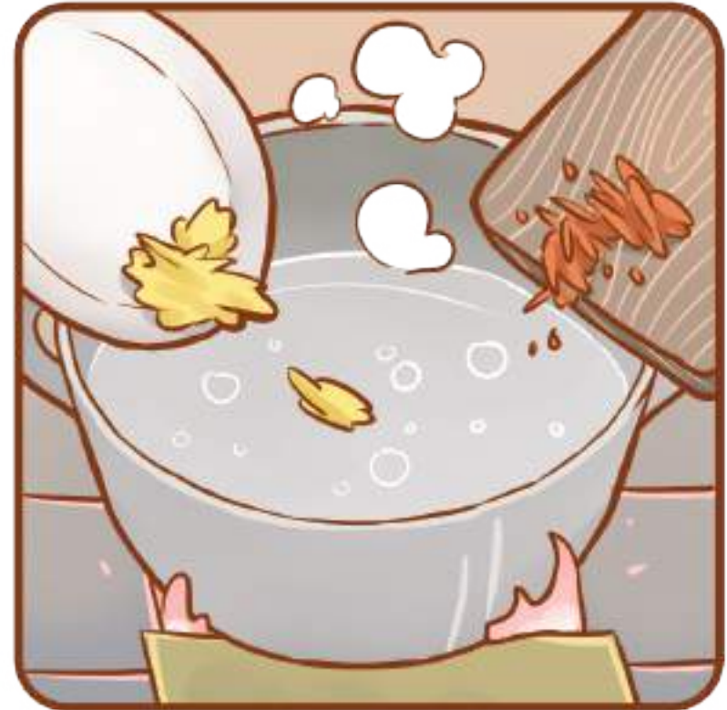
Jahe dan gula kemudian direbus.