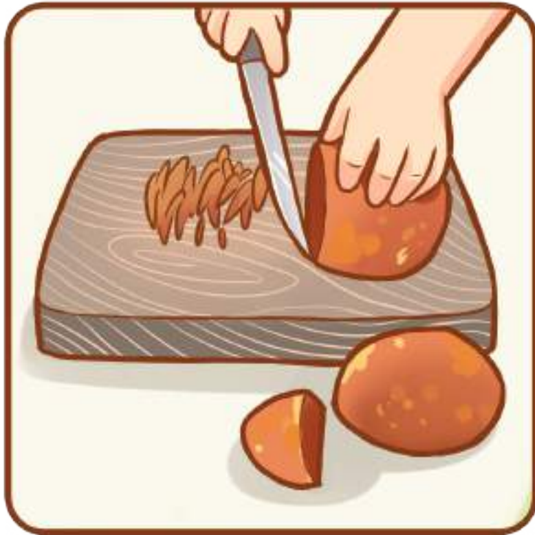
Gula aren diiris tipis.