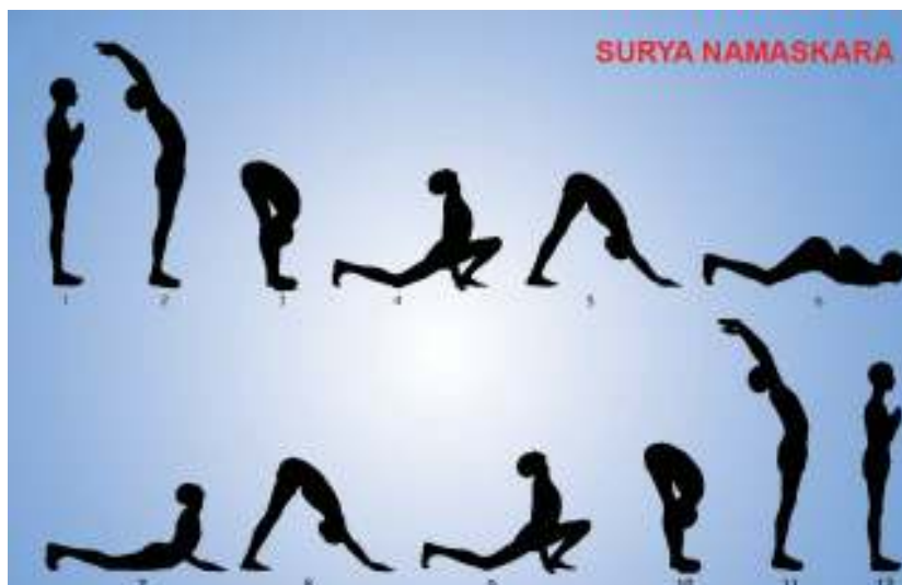
Gambar 3.2 Posisi Yoga Surya Namaskara wujud penghormatan kepada 12 Aspek Surya.

fase zodiak 12 tahun dan bioritme tubuh. Surya namaskara dianggap sebagai latihan rohani yang lengkap karena meliputi asana, pranayama, mantra, dan teknik meditasi untuk keseimbangan jasmani dan rohani.