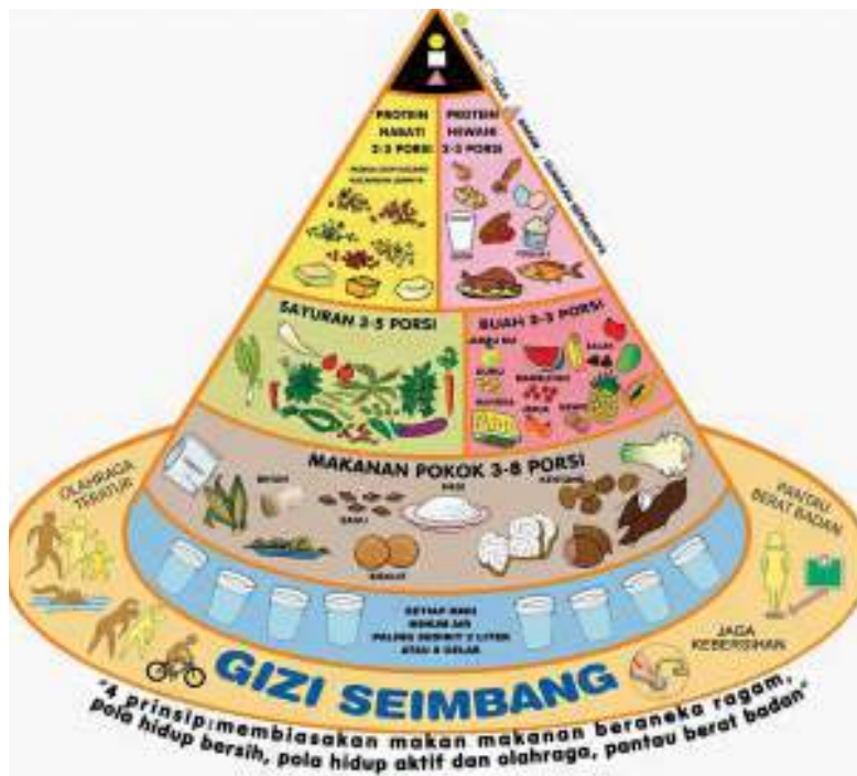
Gambar 3.1 Pola Hidup Sehat

Perhatikan dan deskripsikan gambar di bawah ini!